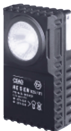
HE 5 EN