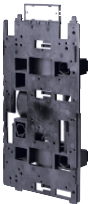
Элемент монтажа (размер 3)