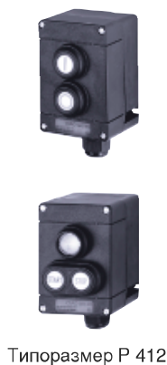
Типоразмер P 412