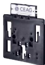
Элемент монтажа, размер 1