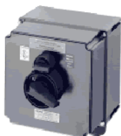
Выключатель, 40 А и 80 А, 3-полярный