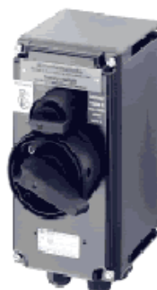
Выключатель, 20 А, 3-полярный