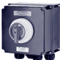
Выключатель с аварийным выключением