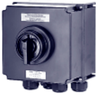
Выключатель 80 А 6-контактный