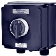
Выключатель с аварийным выключением