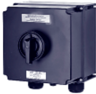
Выключатель 80 А 3-контактный