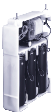
Вставной блок питания