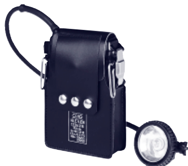
HLE 7 L EN