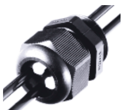
Многопроводный линейный ввод