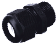
Переходное резьбовое соединение