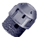
Штуцеры для удаления воздуха