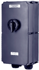
Выключатель безопасности 125 А, 3-контактный