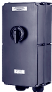
Выключатель безопасности 180 А 3-контактный