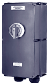
Выключатель безопасности с аварийным выключением