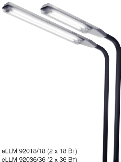
eLLM 92018/18 (2 x 18 Вт) eLLM 92036/36 (2 x 36 Вт)