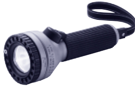
Stabex M0 (Зона 0)