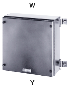
Коробка выводов GHG 745 22