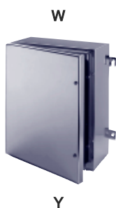
Коробка выводов NEXT