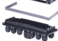
GHG 745 с фланцем