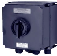
6-контактный выключатель 40 А