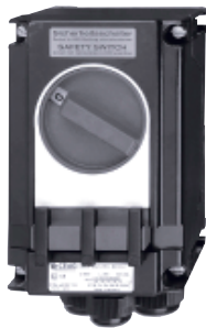
Выключатель для аварийного выключения