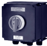
Выключатель для аварийного выключения