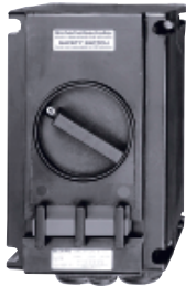
Взрывозащищенный выключатель 3-контактный 40 А