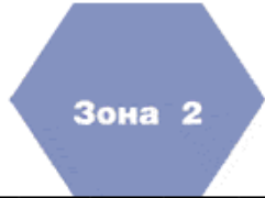
Размеры в мм