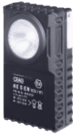
HE 5 EN